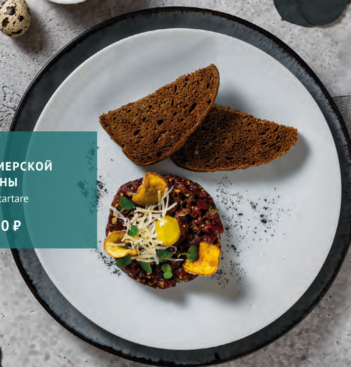
ТАРТАР ИЗ ФЕРМЕРСКОЙ ГОВЯДИНЫ