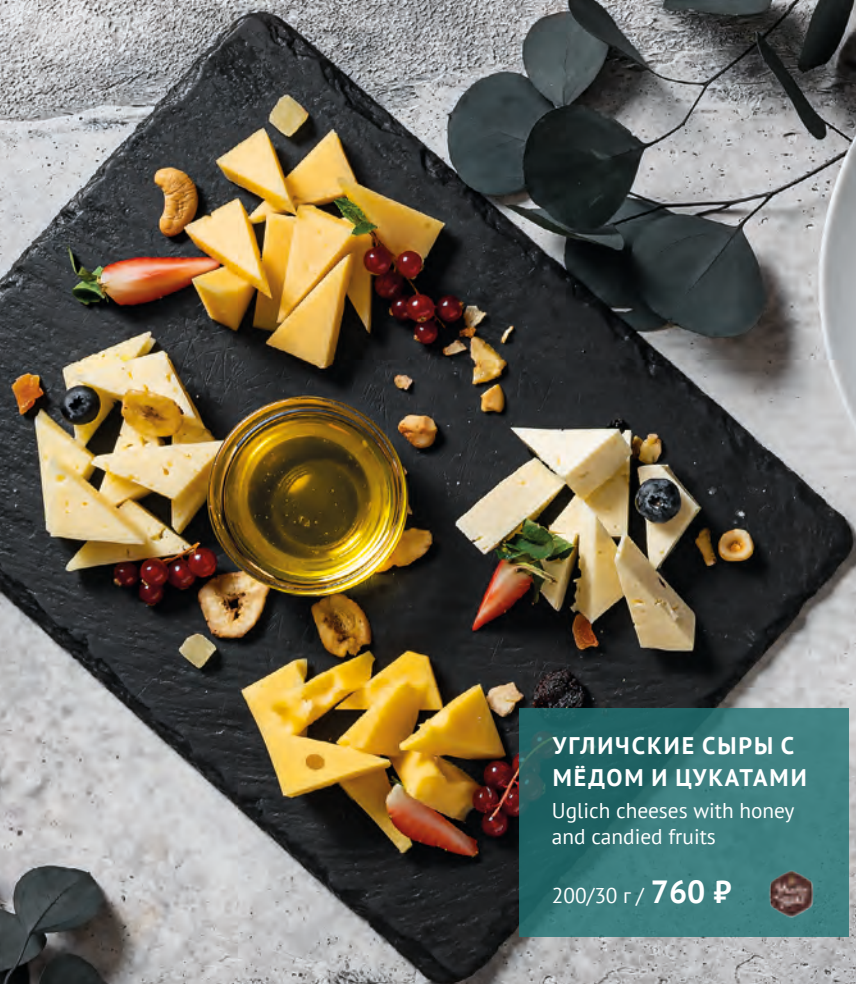
УГЛИЧКИЕ СЫРЫ С МЁДОМ И ЦУКАТАМИ Uglich cheeses with honey and candied fruits