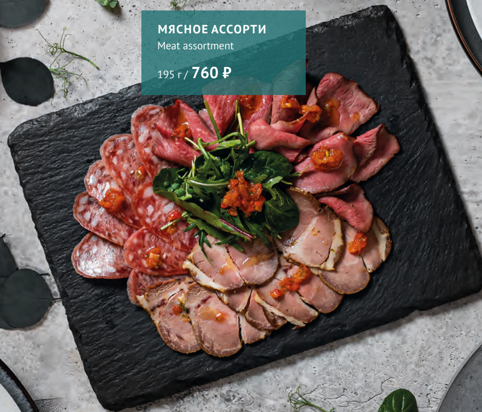
МЯСНОЕ АССОРТИ Meat assortment