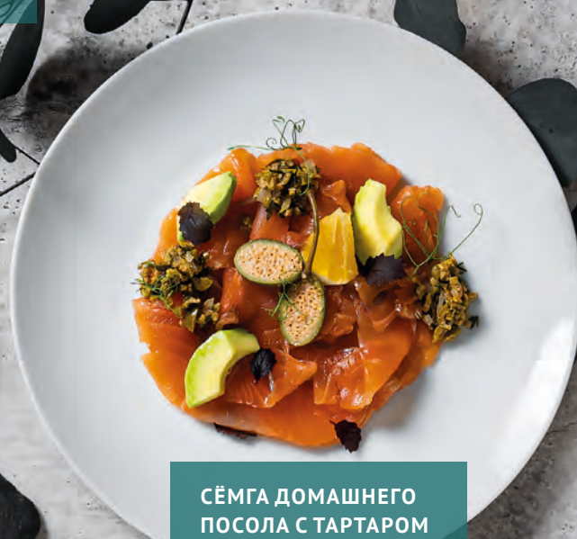
СЁМГА ДОМАШНЕГО ПОСОЛА С ТАРТАРОМ ИЗ ОЛИВОК