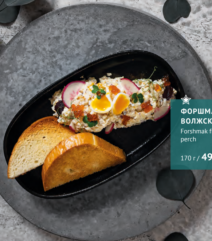
★ ФОРШМАК ИЗ ВОЛЖСКОГО СУДАКА Forshmak from Volga pike perch