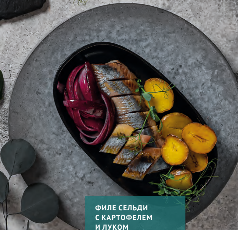
ФИЛЕ СЕЛЬДИ С КАРТОФЕЛЕМ И ЛУКОМ