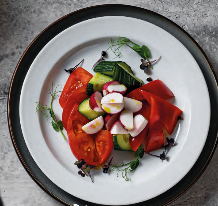
АССОРТИ ИЗ СВЕЖИХ ОВОЩЕЙ